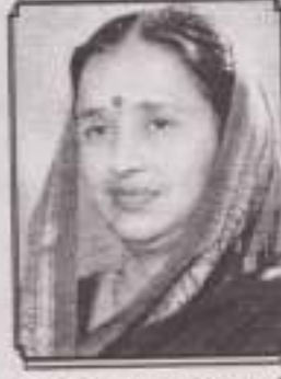
सी. किरणताई महल्ले