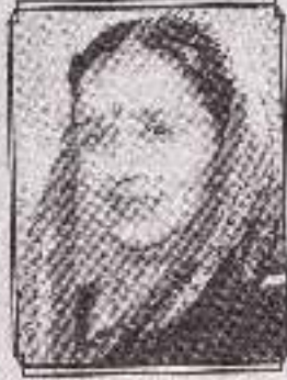
सी. किरणताई महल्ले